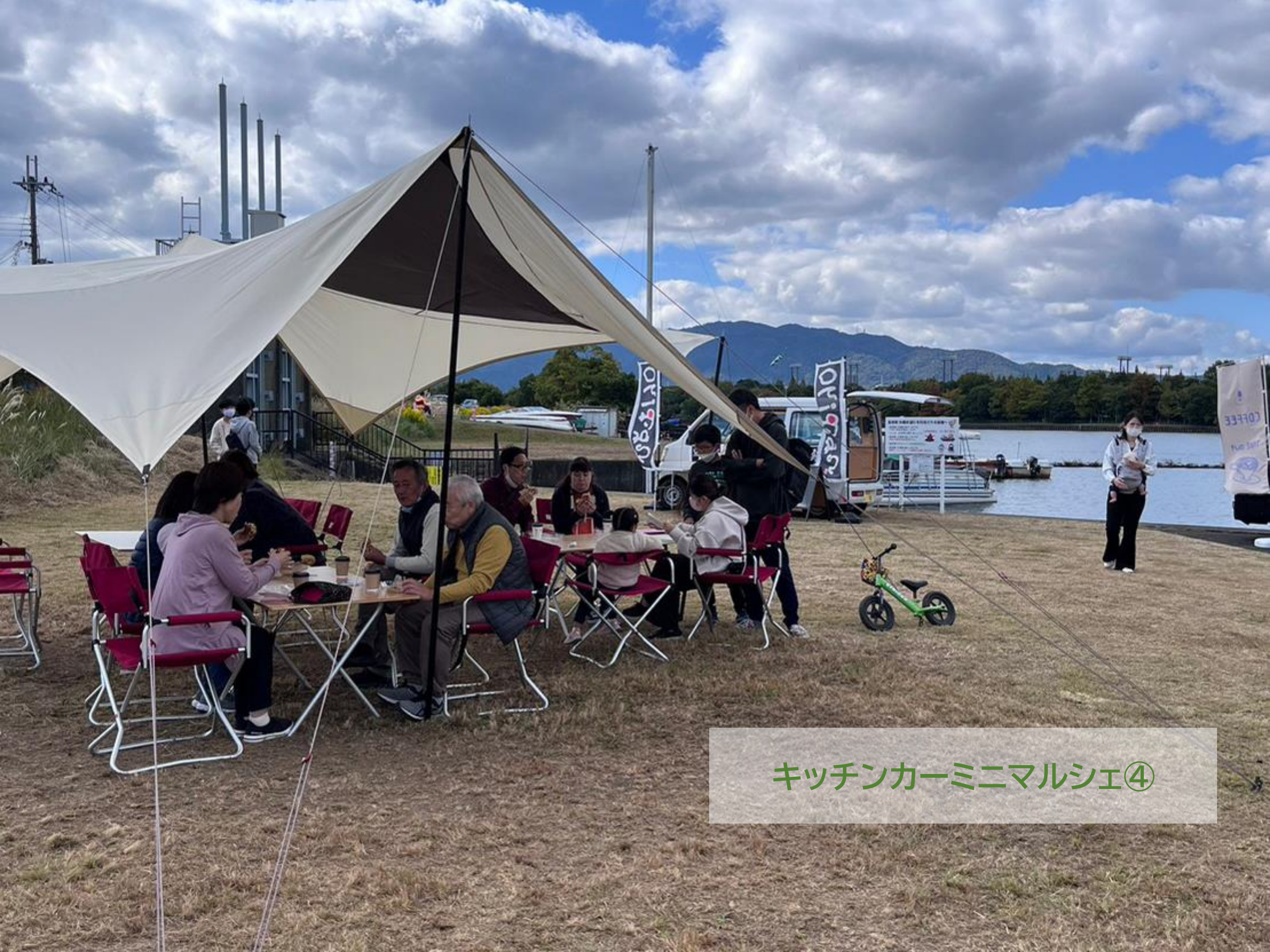
キッチンカーミニマルシェ④